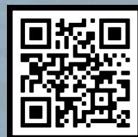
รายละเอียดเพิ่มเติม